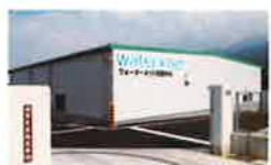
ウォーターネット四国中央工場