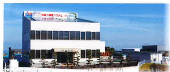
本社・四国中央支店

愛媛県の「愛ロードサポーター事業」や「愛リバーサポート制度」に登録をし、社員全員で近隣の県道や河川の清掃活動を毎月実施しています。また、地域のラブリバー活動(河川清掃)にも参加し、地域の皆さまと共に清掃ボランティア活動に取り組んでいます。